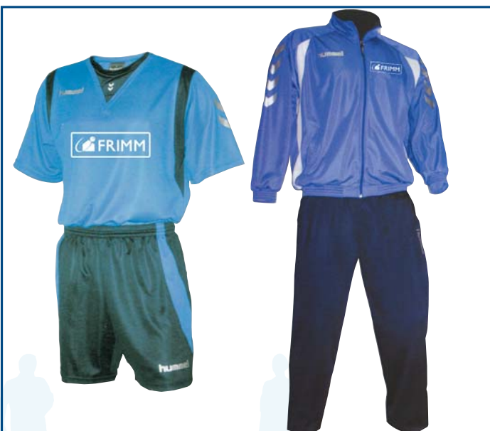
22/1 completo gara € 12,50 22/2 tuta rappresentanza € 24,50