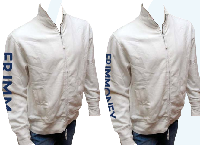
28/10 felpa bianca con zip lunga € 19,50