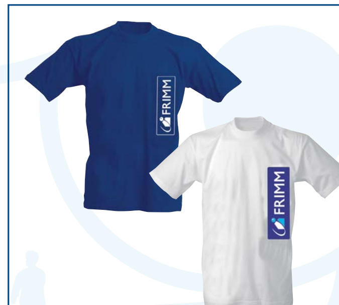
20/5 t-shirt bianca stampa 2 colori g.150 € 1,50 20/7 t-shirt colorata g.150 € 2,25