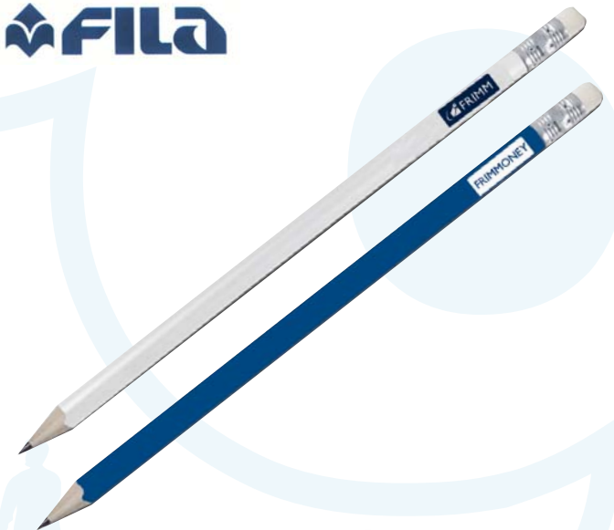
14/6 matita FILA con gommino bianco € 0,19