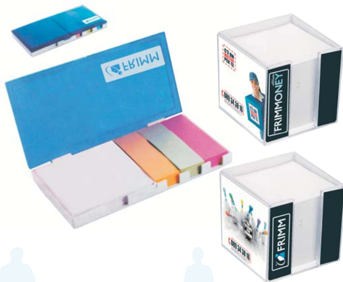
28/8 cubo carta in cristall € 3,90 28/9 custodia in plastica con post-it e block notes estraibile € 2,90