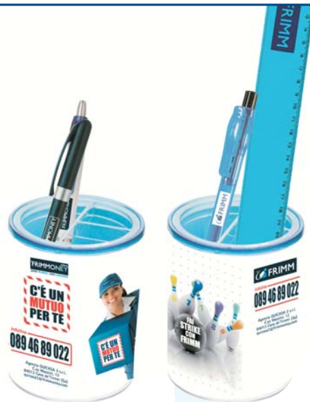
14/9 porta penne in kristall € 2,45 14/7 righello cm 30 € 0,31