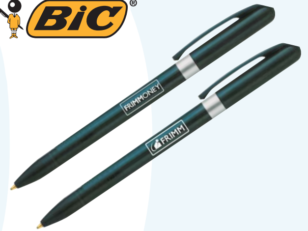
14/10 penna sfera BIC a rotazione refill nero € 0,59