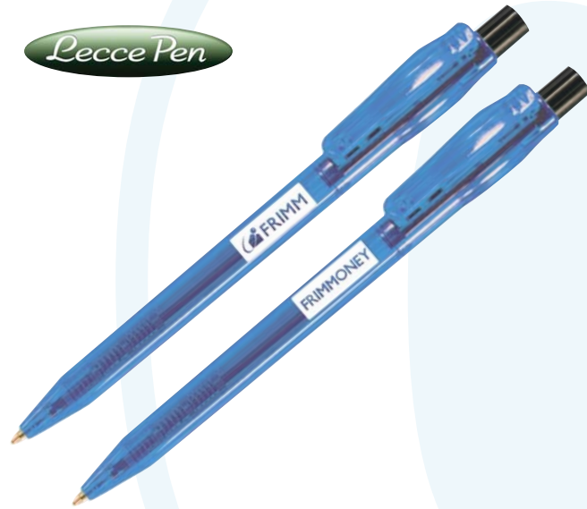
14/4 penna a sfera refill blu € 0,26