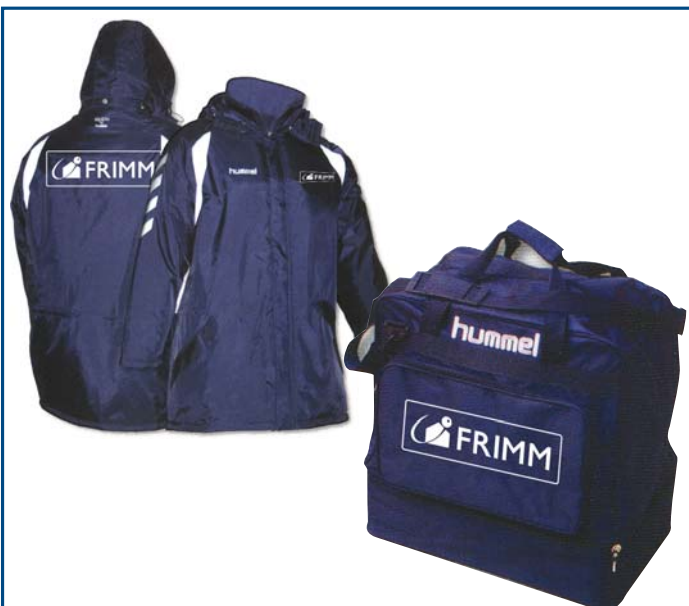
22/3 giubbotto rappresentanza € 24,50 22/4 borsone gara € 12,50