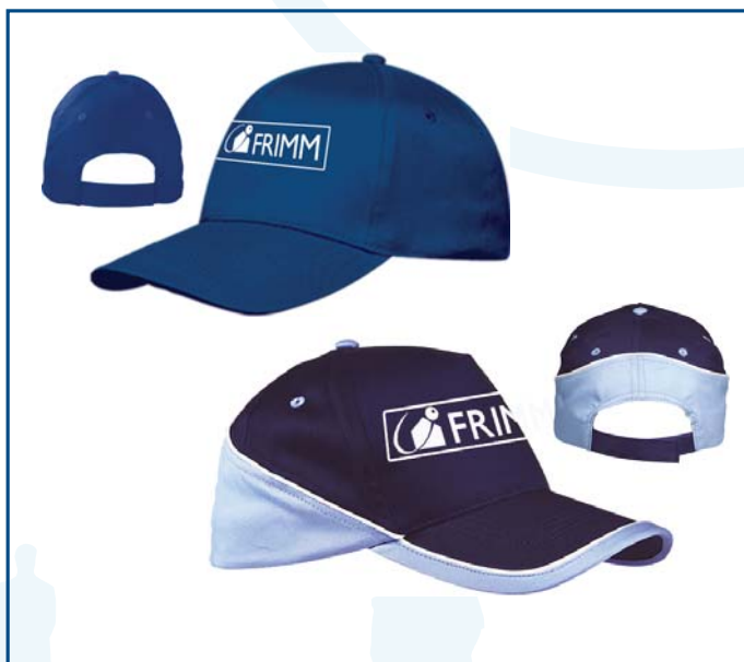
21/1 berretto 5 pannelli bicolore € 1,44 21/3 berretto 5 pannelli € 0,95