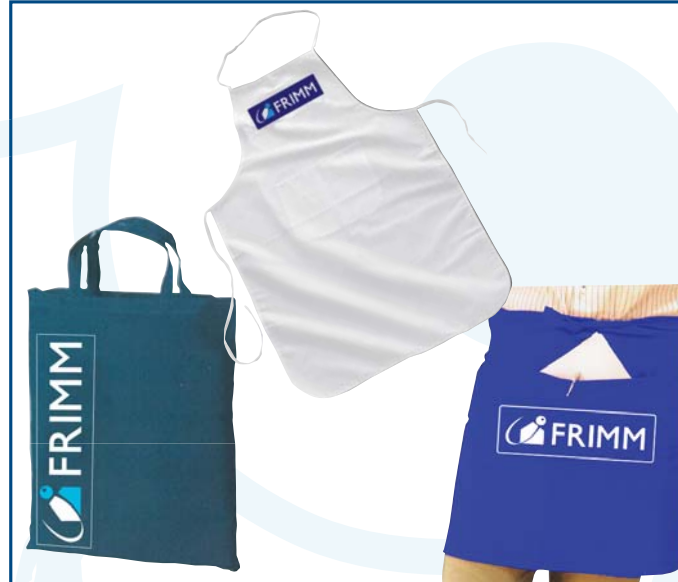
23/8 borsa in cotone € 1,55 26/1 sinalino in cotone € 2,60 26/2b sinalino barman corto € 5,90