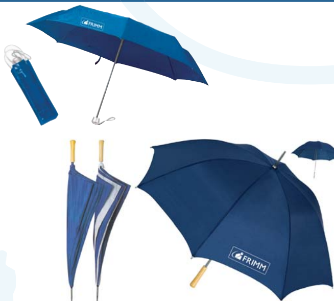
28/2 ombrello medio € 3,30 28/3 ombrello maxi blu € 5,50 28/5 ombrello pieghevole € 4,30