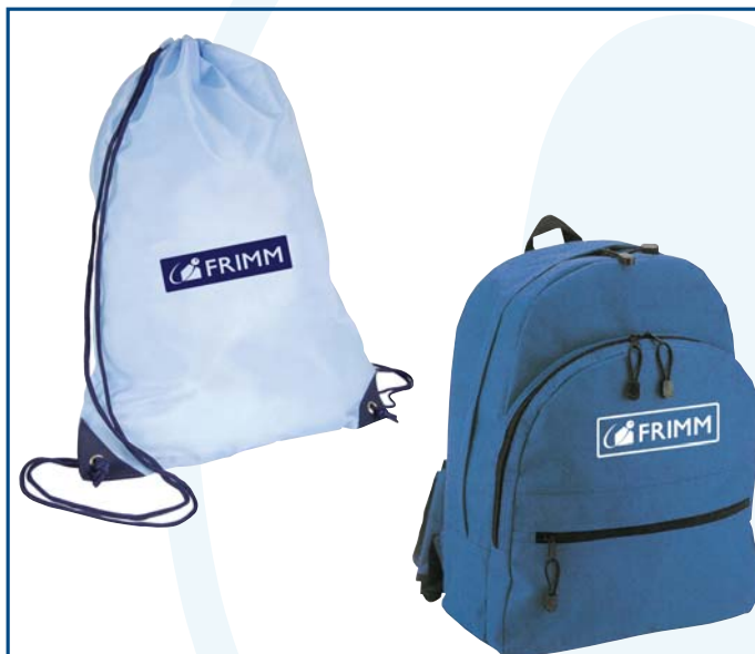
29/2 sacca zaino € 1,35 29/3 zaino € 4,90