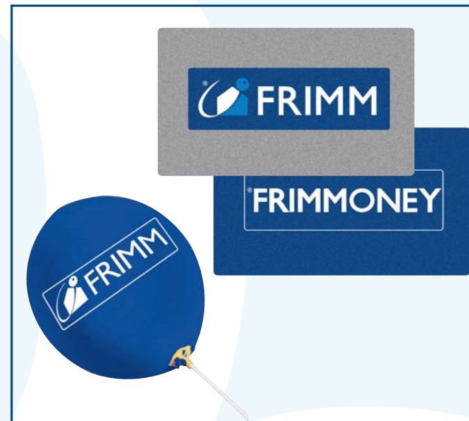
5/3 zerbino in cocco intarsiato cm 125x80 € 195,00 16/4 palloncino con asticina e valvolina € 0,22