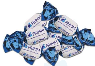
4/3 confezione di caramelle da g.250 € 6,50 16/1 kit spilla da giacca € 2,90