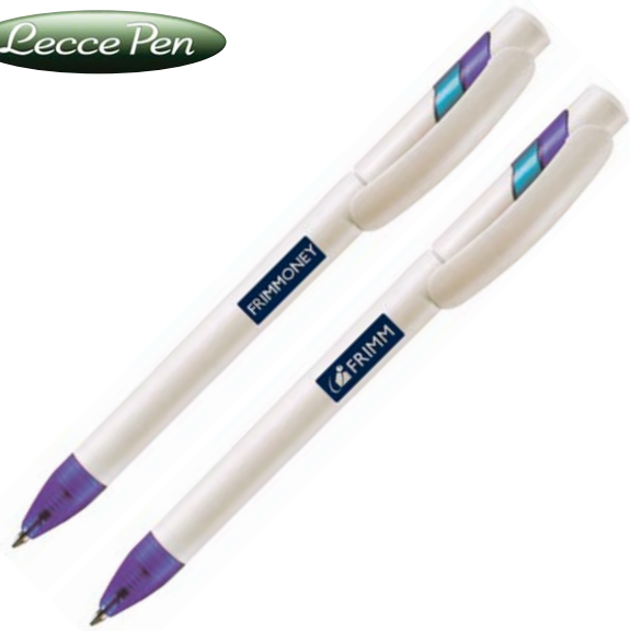
14/8 penna fusto bianco con meccanismo a torsione refill blu € 0,48