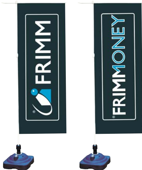
27/1 bandiera per esterno cm 220x80 con supporto per bandiera con base € 135,00